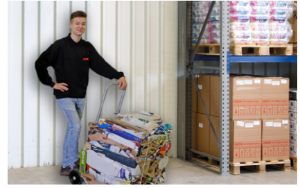
Recogida y transporte con carro de recogida de balas