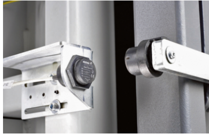
Inicio automático del proceso de prensado tras cerrar la puerta