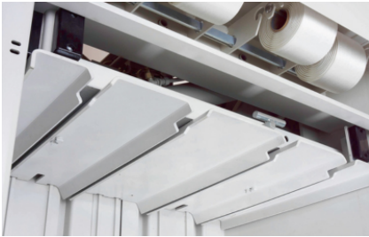
Plancha de prensado maciza con guía excepcionalmente estable